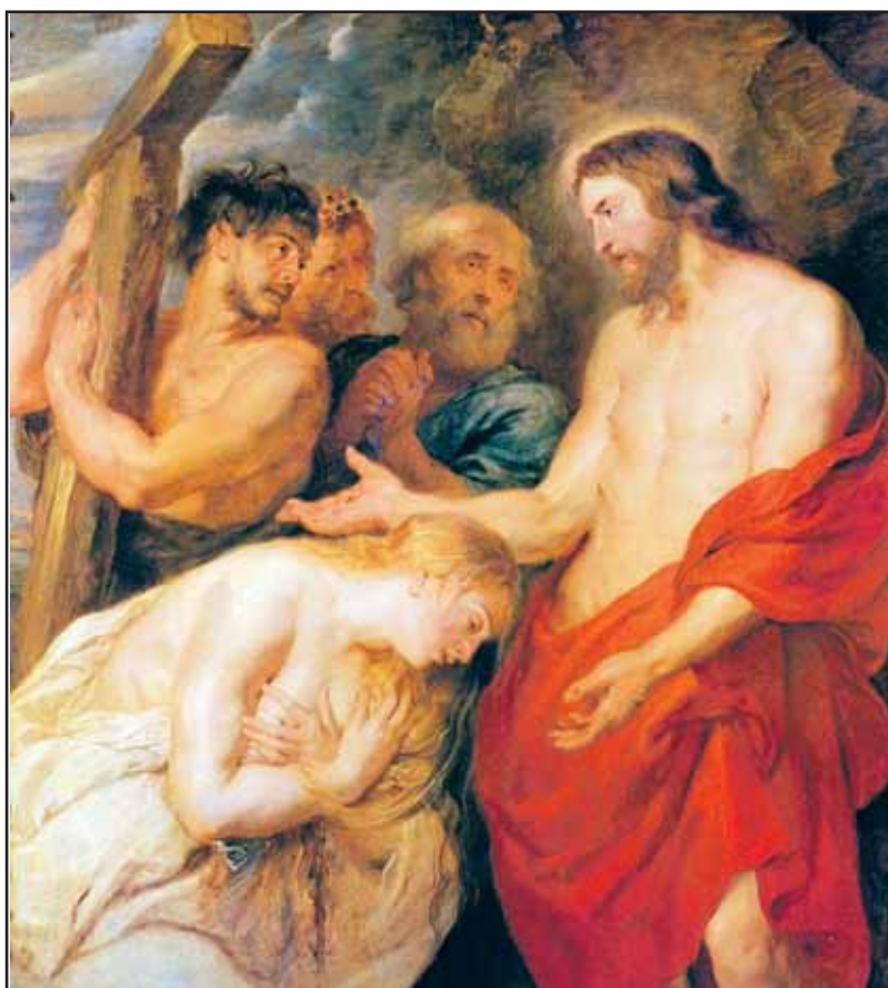
Peter Paul Rubens (1577-1640), Christus und die reuigen Sünder, um 1618